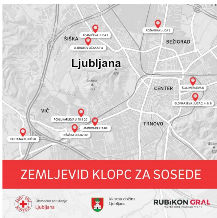
Zemljevid postavljenih klopce za sosede na območju RKS – OZ Ljubljana.