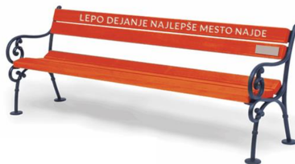
Idejna zasnova klopce za sosede.